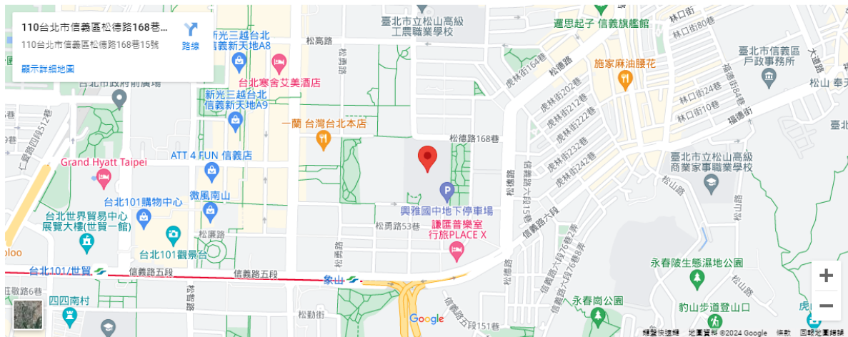
(興雅國中)