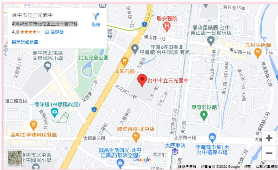
(三光國中 google 地圖)