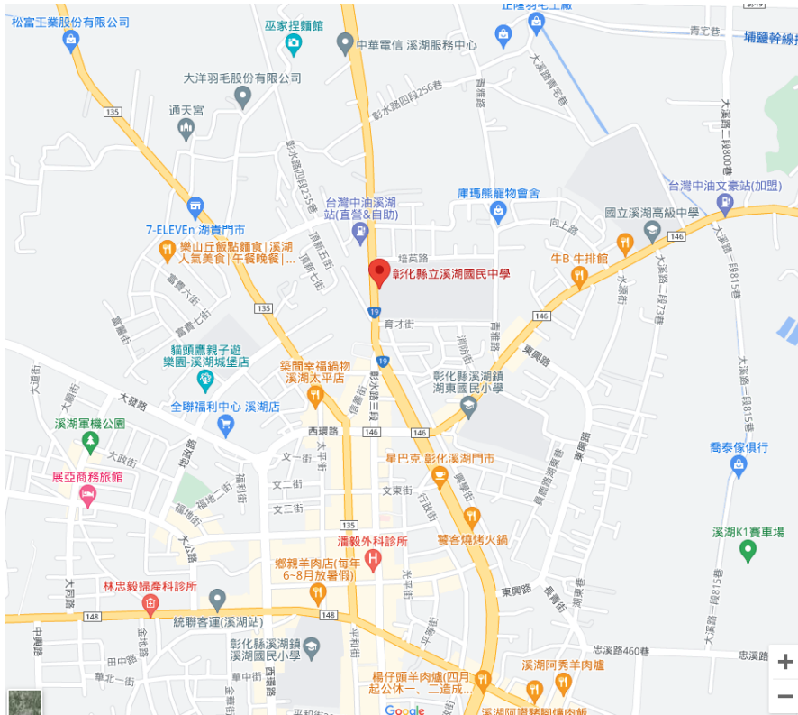
(溪湖國中 google 地圖)